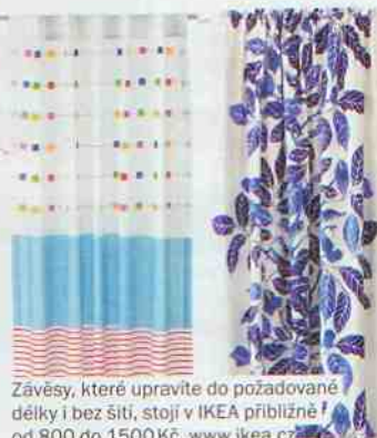
Závěsy, které upravíte do požadované délky i bez šití, stojí v IKEA přibližně od 800 do 1500 Kč. www.ikea.cz