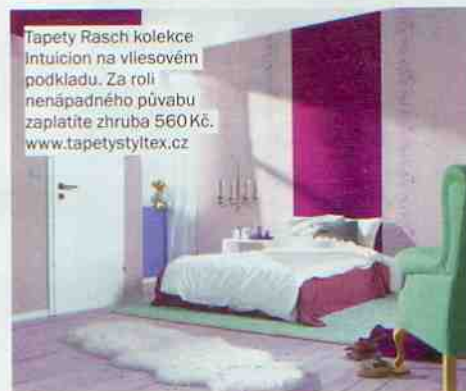
Tapety Rasch kolekce Intuicion na vliesovém podkladu. Za roli nenápadného půvabu zaplatíte zhruba 560 Kč. www.tapetystyltex.cz