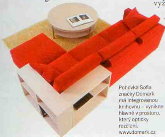
Pohovka Sofia značky Domark má integrovanou knihovnu – vynikne hlavně v prostoru, který opticky rozčlení. www.domark.cz

U nábytku je vhodné, když je přístupný z obou stran. Neměl by být příliš