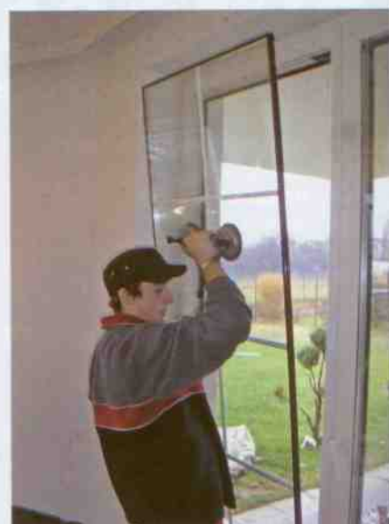
Obr. 2 Vyjmutí nevyhovujícího zasklení