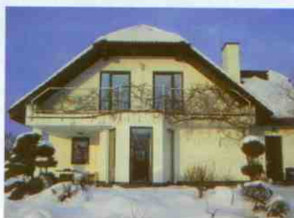
Obr. 3 a 4 Přesklení rodinného domu u Frýdku-Místku

potvrdit autorizovaný projektant a teprve potom se kompletovala žádost o dotaci. Jako přílohy této žádosti bylo potřeba doložit výpočty, zpracovaný projekt na zateplení a smlouvu o dílo včetně kódů certifikovaného produktu (obr. 2, 3 a 4).